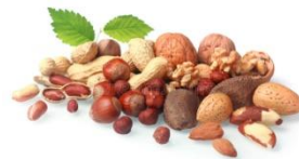
verse noten of rozijnen