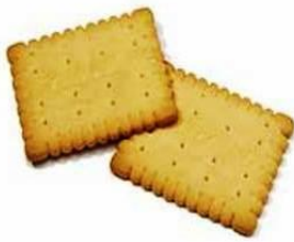
droge koek (kinderkoek)