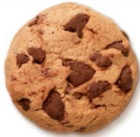
koek met stukjes chocolade in