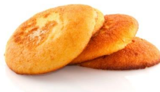
droge eierkoek zonder vulling