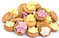
koekjes met suiker op